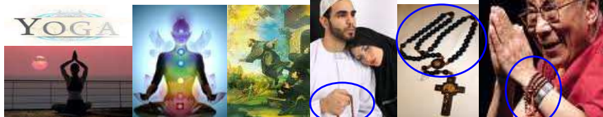
Tanto musulmanes como budistas, tibetanos y católicos romanos rezan rosarios.