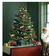
Árbol de pino adornado para La Fiesta actual de la Navidad.