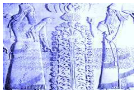
Imagen Babilónica tallada en piedra del árbol de la Fiesta de la Navidad de Tammuz.

POR ESTA CAUSA DEBEMOS TENER MUCHO CUIDADO CON LAS CELEBRACIONES QUE LLEVAMOS A CABO SIN QUE ÉSTAS TENGAN MANDAMIENTO EXPRESO DE YHWH , YA QUE PODRIAMOS ESTAR PRACTICANDO FIESTAS PAGANAS ( ABOMINACIONES ) A FALSOS DIOS EN HONOR A YHWH .