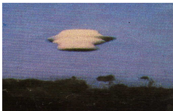
Curiosa “NUBE” fotografiada desde un avión de la USAF sobre Islandia, en 1955.