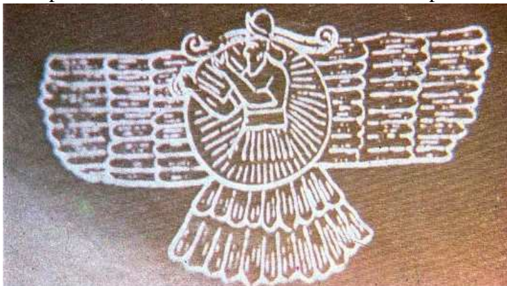
La antigua Babilonia es cuna de una sugestiva cultura “espacial”. Este grabado mesopotámico exhibe la imagen de un dios que navegaba por los cielos en un círculo alado.

Rapto de ELÍAS: manifestación angelical 2º Reyes 2:11-12. Siguiendo con ese razonamiento, las apariciones en la actualidad deben responder a los tiempos que corren. En los días de Elías era natural ver a los ángeles como carros de caballos aunque hoy en día, en nuestros tiempos, es posible que el mismo avance tecnológico sea quien nos lleve a verlos como naves espaciales. Desde tiempos remotos los hombres han afirmado haber visto extraños objetos en el cielo. Los indios americanos, por ejemplo, conservan leyendas que hablan de canoas voladoras . Los antiguos romanos